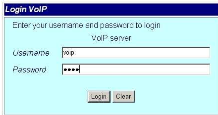
Рис . 1

Все настройки GSM шлюза AllVoIP производятся только через веб-интерфейс (доступ по умолчанию http://192.168.0.100 ). Для конфигурирования шлюза рекомендуется использовать Internet Explorer. После подключения к шлюзу необходимо пройти авторизацию (Рис. 1), для этого вам надо ввести имя пользователя и пароль (по умолчанию username = voip, password = 1234).